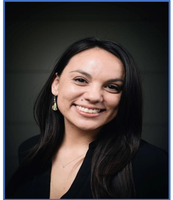
Asesora de investigación del programa

“La ciencia transforma vidas, es la fórmula para hacer de esta una sociedad más incluyente que camine hacia un mundo más justo, más sustentable, un mundo en paz”